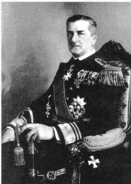
Portretul amiralului Miklós Horthy (1868–1957)

În noiembrie 1919, armata română a fost prima care a intrat în Budapesta pentru a sprijini înlăturarea regimului lui Béla Kun, pregătind, astfel, investitura amiralului Horthy. În următoarele zile, represiunea contra comuniștilor (cunoscută ca „teroarea albă”) a fost foarte sângeroasă, încât puterile internaționale s-au văzut obligate să intervină din nou, de data aceasta pentru restabilirea ordinii.