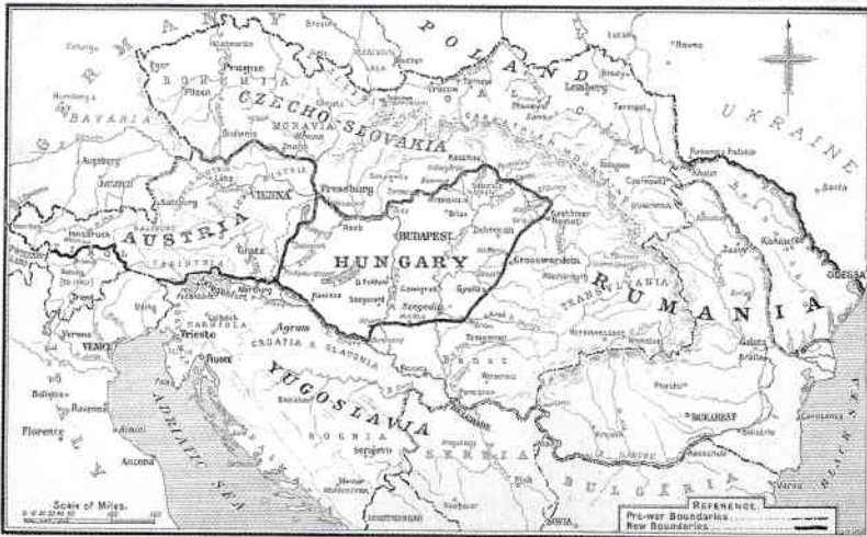
THE PARTITION OF AUSTRIA-HUNGARY: SHOWING THE BOUNDARIES AS DEFINED IN THE TREATIES.

În martie 1920 s-a reinstaurat monarhia, iar domnia i-a fost încredințată lui Horthy, care s-a menținut ferm pe poziții până în 1944. În toată această lungă perioadă, Horthy a luptat contra pericolului comunist, reușind să reunească puteri conservatoare, dar diferite între ele: catolici și protestanți, profasciști și rasiști