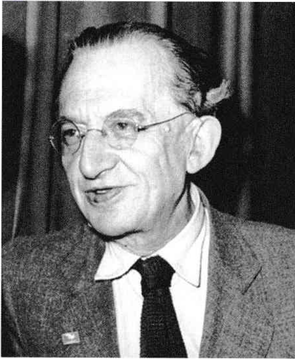
György Lukács (1885–1971)

dinamicilor interne. Din acest an până în 1956, Mátyás Rákosi (1892–1971) va prelua frâiele puterii, impunând dictatura și implementând o serie de reforme a căror origine stalinistă era evidentă, precum și o represiune nemiloasă contra opoziției. Ungaria devenea una dintre țările-satelit ale Uniunii Sovietice a lui Stalin, iar Moscova se pregătea să exercite un control sever asupra țării dunărene. În acest context, Lakatos primește postul de secretar al comitetului științific al partidului: în noua sa funcție s-a ocupat, printre alte sarcini, de raportarea către partid a acelor profesori care îi corupeau pe studenți, educându-i după principiile liberalismului burghez. Era vorba despre o adevărată vânătoare de vrăjitoare, care îi viza și pe membrii Colegiului Eötvös, unde studiase Lakatos.