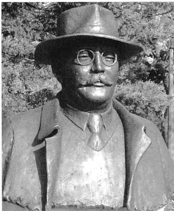
Statuia lui Imre Nagy (1896–1958)

Ascensiunea lui Lakatos și influența în partidul comunist ungar nu erau menite să dureze prea mult. Șederea sa la Moscova în 1948 a schimbat întreaga situație: în capitala rusă, Lakatos și-a făcut mulți dușmani din cauza personalității sale nonconformiste, care nu făcea casă bună cu lipsa de flexibilitate a comunismului de rit stalinist. La întoarcerea în Budapesta, Lakatos a plătit pentru consecințele comportamentului său rebel: i s-a refuzat înnoirea carnetului de partid, i s-a retras apartamentul pe care însuși partidul i-l pusese la dispoziție ca urmare a ocupării funcției de înalt oficial, dar mai presus de toate a început procesul în care i se reproșa moartea Evei Izsak; era acuzat că o convinsese să-și sacrifice viața pentru binele tovarășilor ei partizani. Credeau că tânăra