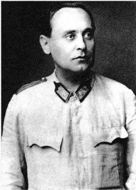
Ferenc Szálasi, liderul Partidului Crucilor cu Săgeți, partidul pronazist ungar

Istoricilor le este dificil să decidă dacă regimul lui Horthy a fost unul fascist sau un regim pur și simplu autoritar și conservator. Argumentele care ar înclina în favoarea primei ipoteze sunt diverse: